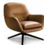
6 JENSEN FAUTEUIL CM 81X85 H78