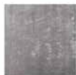
7 DIBBETS TAPIS CM 400X300